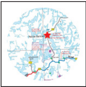
Pelican Narrows (SI)